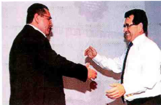
מויאל נחשב לחבר אישי ומקורב מאוד ליו"ר ההסתדרות עופר עיני

לפוליטיקאים אחרים שמדברים על בניית דירות חדשות באשדוד, ולמרבה הצער כלל לא מבינים על מה הם מדברים, אני מגיע עם ניסיון מוכח ועם ידע משמעותי מאוד בתחום הבנייה, לכן אני גם רוצה להציג לציבור מה אני הולך לעשות. סיכמתי כבר עם שתי חברות גדולות מאוד 'שיכון ובינוי' ו'אשטרום' כי הם יובילו באשדוד את פרויקט 'פינוי-בינוי', שלמעשה יחדש את הרובעים הוותיקים בעיר.